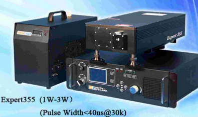
Expert355 (1W-3W) (Pulse Width<40ns@30k)

ILOPE 2013北京国际光电产业博览会暨 第十八届北京国际激光·光电子·光电显示产品展览会 北京·中国国际展览中心1A、1B、2A、2B馆 时间: 2013年10月16日—18日 展馆号: 1号馆B厅1B34