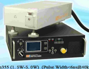
MBurn355 (1.5W-5.0W) (Pulse Width<6ns@40k)